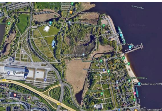
IGA Park Rostock auf google maps