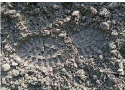
unser Fußabdruck – schwer und massiv