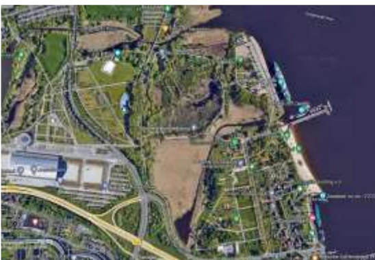
IGA Park Rostock auf google maps