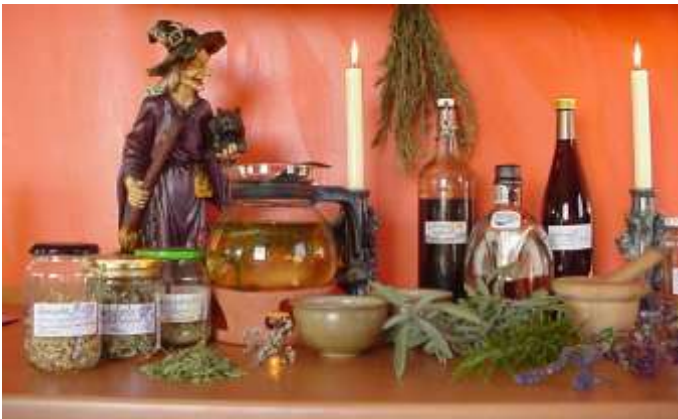
Kräuter im Gebrauch