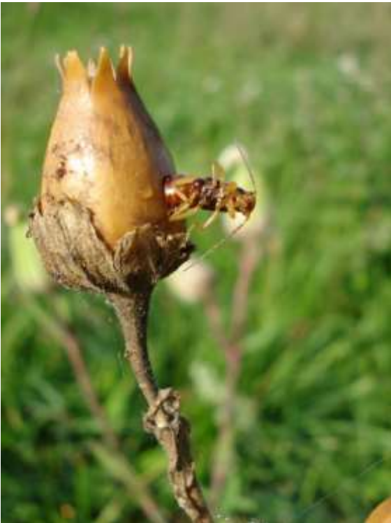
Nützling oder Schädling?