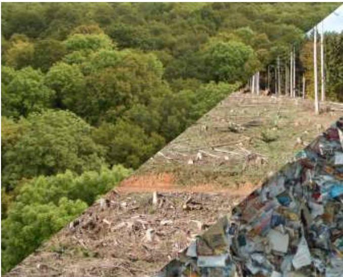
Werdegang des Papiers