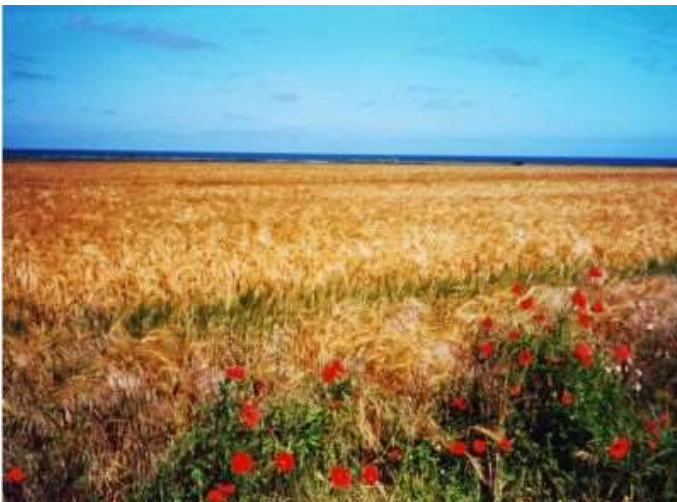
Getreidefeld im August