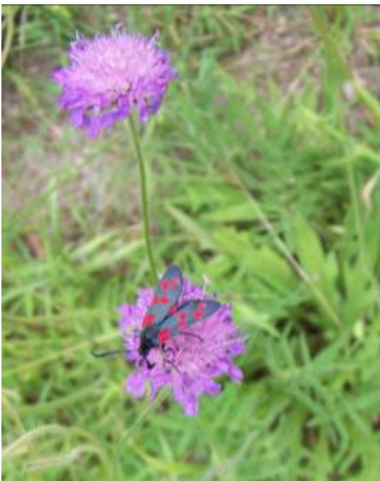
ein seltener Tagfalter – das Widderchen oder auch Blutströpfchen