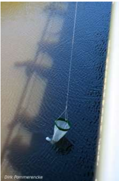
Arbeit mit dem Planktonnetz