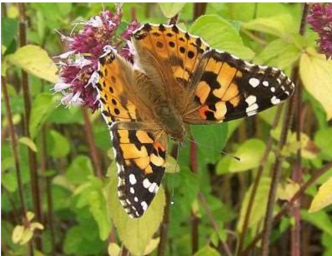
Oregano mit Diestelfalter